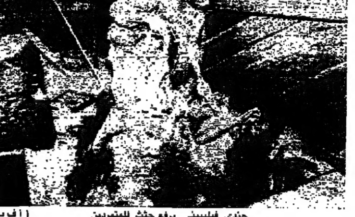
جدي فيليبيني يرفع حث للمشردين

علم من مصادر رسمية في الفلبين ان ثمانية اشخاص بينهم جنرال، اقتلوا في الاشتباكات التي وقعت أمس الاول بين القوات المسلحة الفلبينية، وانصار حكم اكينو من منصبه ومعد للرئيسة الفلبينية كوراسون اكينو. اشاعت اجهزة ذاتها، ان ١٨ شخصاً اصيبوا بجروح في الاشتباكات ذاتها. وبعد ان اعدت النظام مساء أمس الاول بدأت وحدات الجيش الموالية لاكينو أمس حملة تقطع من منزل الى منزل في مدينة تونغويغار، او عاصمةقليم كاغايان، بحثاً عن الحاكم رودولفو اكينو الذي تتهمه السلطات بانه اعطى شخصياً اموالاً باعدام الجنرال اوسكار فلورنوتو، حيث نجحوا بالقاء القبض عليه. وفي الوقت ذاته، نشر الضباط المسؤولون عن محاولة التمرد التي جرت في كانون الاول الماضي، وادت الى قتل ١١٩ قتيلاً واكثر من ٥٠٠ جريح، في مانيلا بينما اكثروا فيه دعمهم لاكينو وانصاره، ووجوهوا تهديدات غير مباشرة بالقيام بعملية عسكرية جديدة ضد الحكومة. ويأتي هذا البيان في وقت تسري في مانيلا منذ انتهاء تمرد كانون الاول الماضي شائعات يصعب التحقق من صحتها. وكان الجنرال فلورنوتو توجه الى الشمال برفقة وزير الجماعات المحلية لويس سانتوس، ليقيم شخصياً بالاباغ في اقليم تونوكا، في حقه لانجمله ب«التعدي والقتل» وتقول السلطات ان انصار للحكم